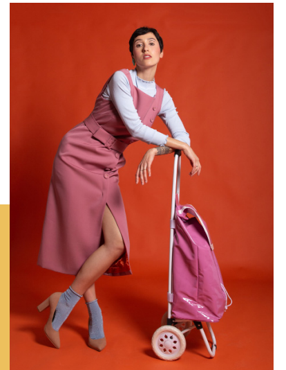
Robes Carlotta & Twiggy (modèles déposés), confectionnées à Paris, en 40 exemplaires numérotés.