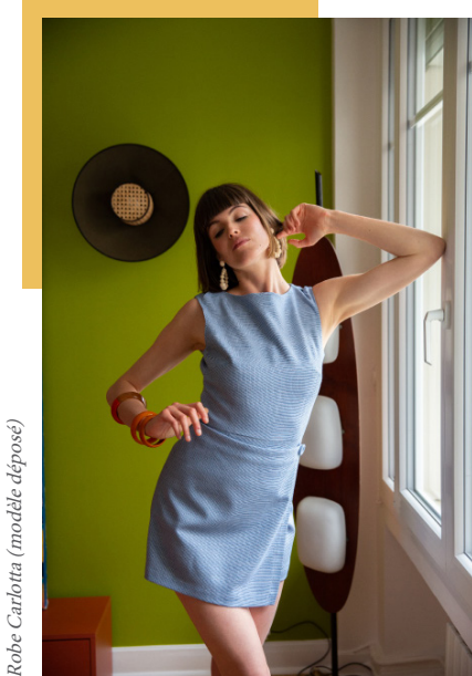
Robe Carlotta (modèle déposé)

De cette première vie professionnelle, Scarlett aura conservé un certain goût du défi. Ici, proposer des robes dont l'élégance n'a d'égale que l'impertinence. Des robes pouvant être portées aussi bien en entretien annuel avec son N+12 qu'à l'occasion du vernissage de la dernière exposition en vue du Grand Palais. Des robes véritablement Couture, pensées pour toutes les aventures.