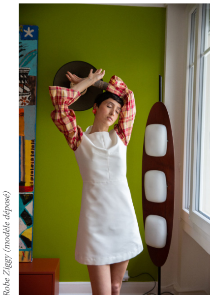
Robe Ziggy (modèle déposé)